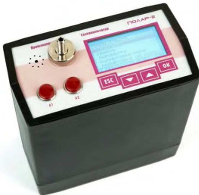
Рисунок 1 – Внешний вид газоанализаторов «Полар-2»

Вид взрывозащиты – «искробезопасная электрическая цепь i» по ГОСТ Р 52350.11-2005 (МЭК 60079-11:2006) и «взрывонепроницаемая оболочка d» по ГОСТ Р 52350.1-2005 (МЭК 60079-1:2003).