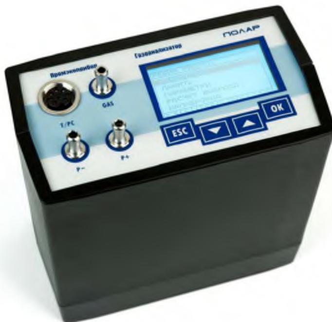
Рисунок 1 – Внешний вид газоанализаторов «Полар»

Конструкцией газоанализатора предусмотрена пломбировка корпуса от несанкционированного доступа в месте установки одного из винтовых соединений. Схема пломбировки и размещения обозначение места наклейки «знак поверки» приведена на рисунке 2.