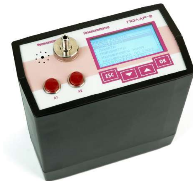
Рисунок 1 – Внешний вид газоанализаторов