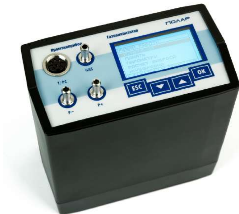
Рисунок 1 – Внешний вид газоанализаторов